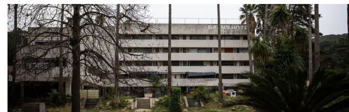
Franjevački samostan, Knežev dvor, park Mayneri, paviljon YOUR BLACK HORIZON, Vila Vesna, Spomenik Viktoru Dyku, Hotel grand Lopud