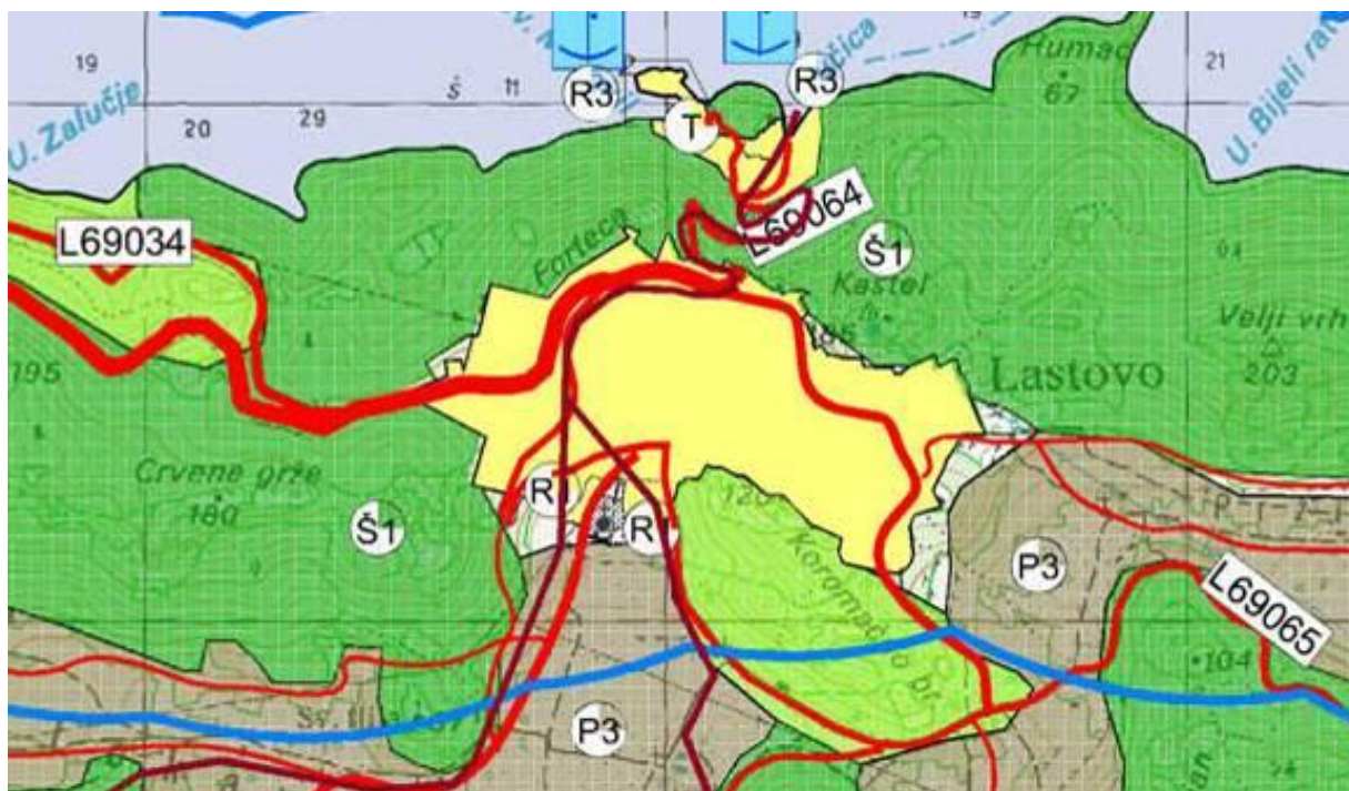
KARTOGRAM 1 / Izvadak iz PPUO Lastovo-a, grafički prikaz / : Korištenje i namjena površina

Osnovni prostori, novi objekti i tereni zbog većih potreba stanovništva, a i zbog gostiju/turista planira se sportsko-rekreacijski centar u Lastovu, sa sportskom dvoranom zapadno od nogometnog igrališta.